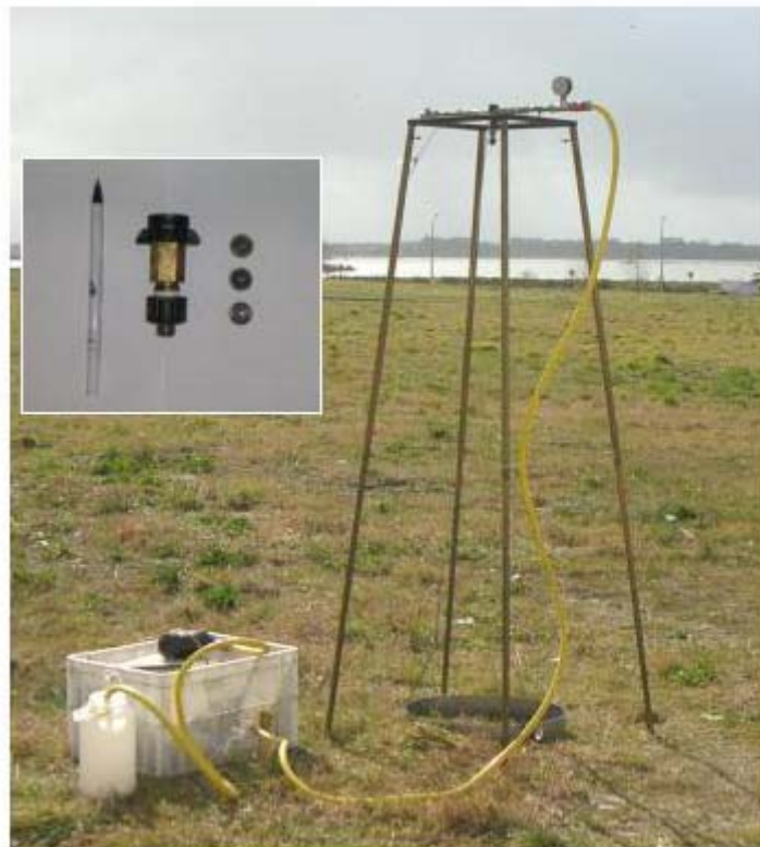
Figura 3 - Impressão do simulador da chuva desenvolvido por Cerdà et al. (1997).